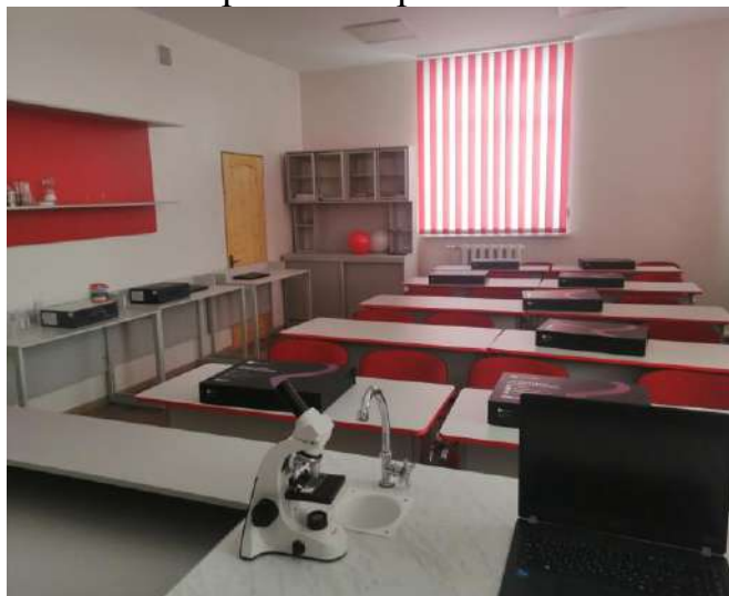
«Точка роста» Харганатская СОШ